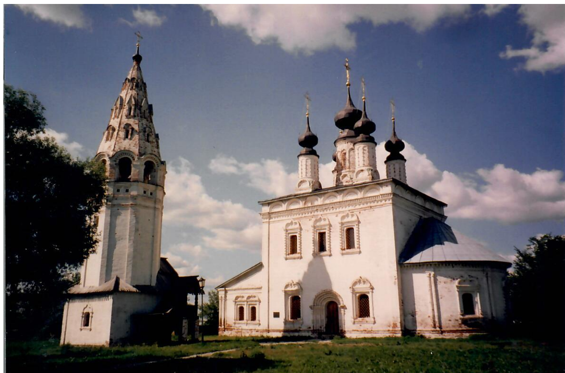
Monastero di Sant' Alessandro della Neva