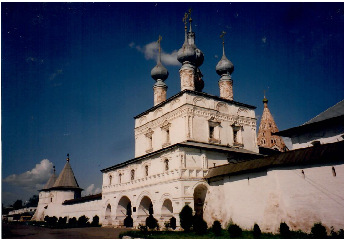
Monastero di Boris e Glebb