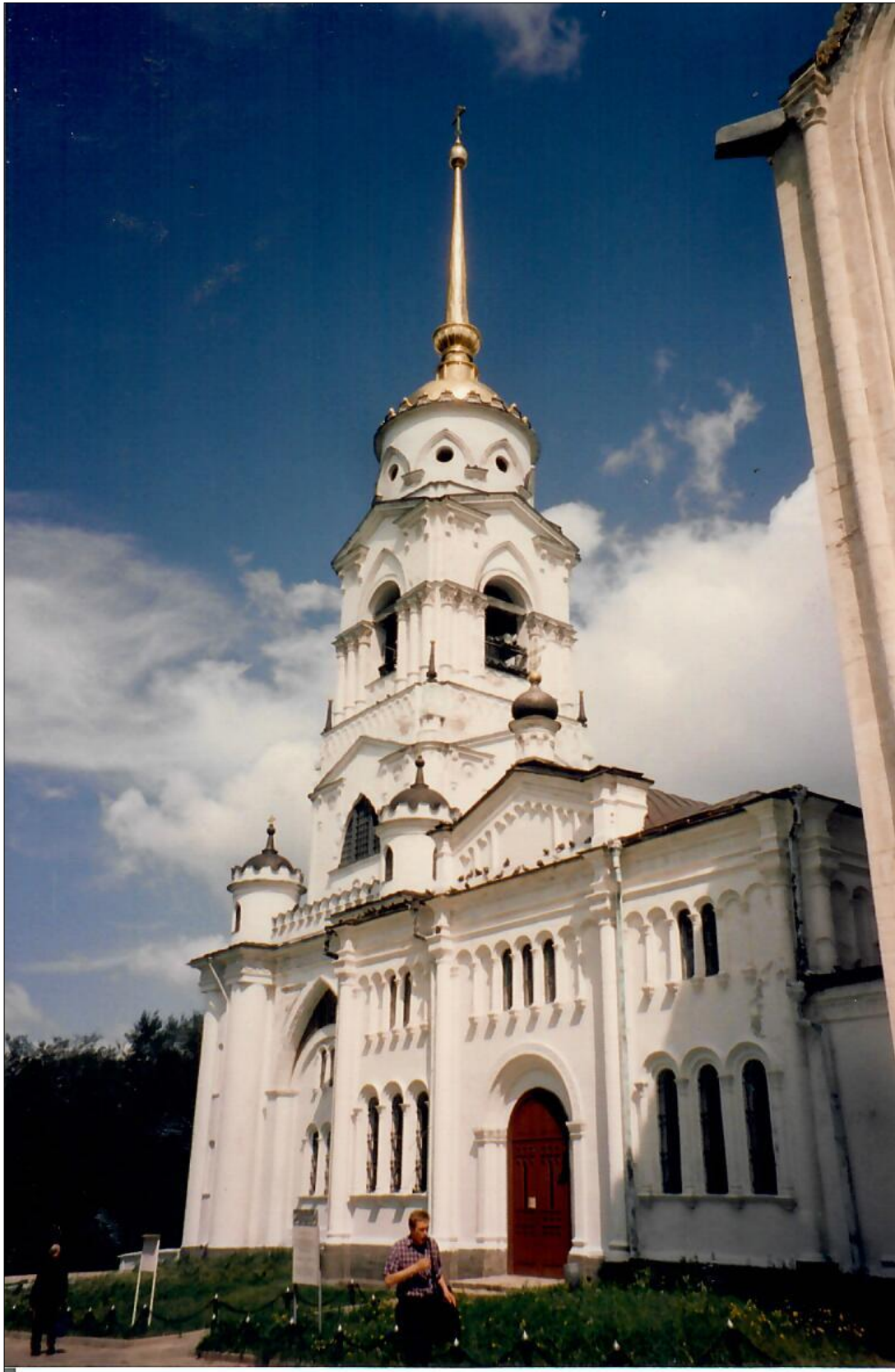
Andiamo a vedere la Cattedrale della Dormizione , buona descrizione di Marina 2. Purtroppo, la possiamo vedere solo dall'esterno; speravamo