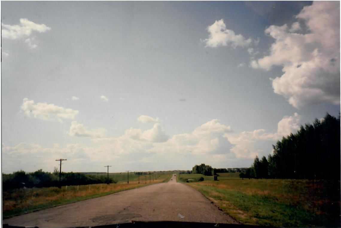
Da Suzslovl a Kideksa