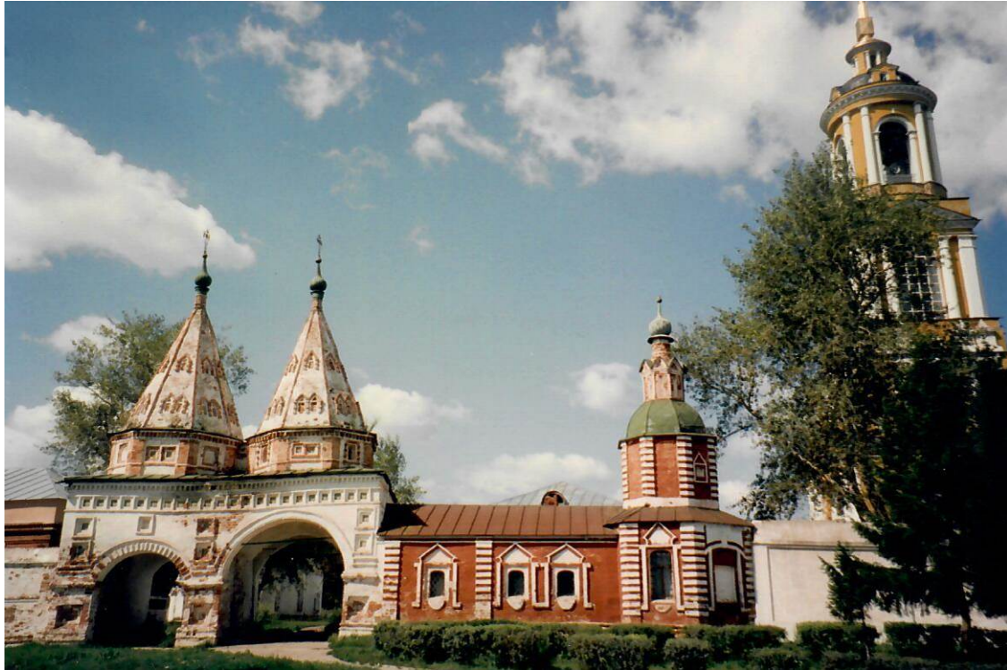
Porta Sacra Chiesa delle Deposizione della Veste della Vergine